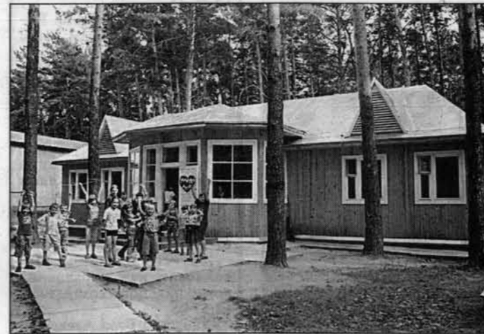
В этом вновь отреставрированном теремке живут самые маленькие.

В сосновом бору на берегу речки Черемшанки расположился детский лагерь Барнаульского станкостроительного завода. Вопреки экономическим трудностям последнего десятилетия предприятие сумело сохранить лагерь, который по итогам прошлого сезона занял первое место в краевом смотре-конкурсе. Этим летом возможность окрепнуть, набраться здоровья и сил получают 1300 девчонок и мальчишек.