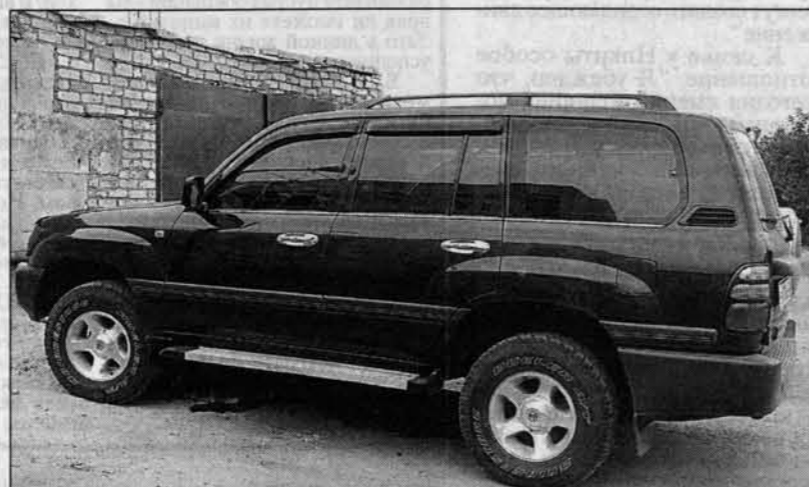
Московский "Тойота-Ленд-Крузер-100" остался в Барнауле, теперь главное - убрать его от новых воров.

Правда, не совсем понятно, почему ГТК объявил о промахе из них такого громадного количества ПТС спустя длительное время после их исчезновения. Видимо, ситуация такова: сначала нужно было продать ворованные ПТС, на них поставить ворованные или незаконно ввезенные из-