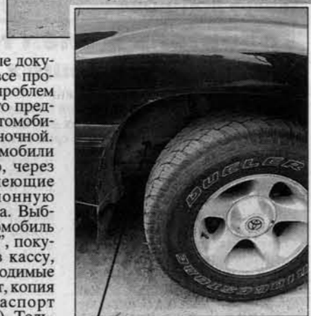
Идентификационный номер у всех "Крузеров" наносится на раму в районе правого переднего колеса, и его удобно подделать.

Странным было и появление в Барнауле представителя владельца угнанного автомобиля. Не имея на руках практически никаких серьезных документов, он больше рассчитывал на громкую фамилию бывшего владельца автомобиля. Однако работни-