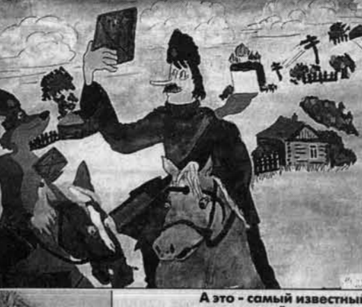
А это - самый известный сказочный почтальон.

Справка "АП": Всего в Управлении федеральной почтовой связи по краю работают 7797 человек, из них 3227 - почтальонов. На Барнаульском почтамте работают 1106 человек, а почтальонов в столице края 286. В трех Барнаульском почтамта по обработке почтовых отправок в сутки поступает более 70 тысяч писем (43 тысячи - из других регионов, 31 тысяча - из района). Все письма обрабатываются вручную. С помощью электропечки производится обработка ценных бандеролей и писем, посылок. В ближайшее время будет компьютеризирована обработка заказных писем.