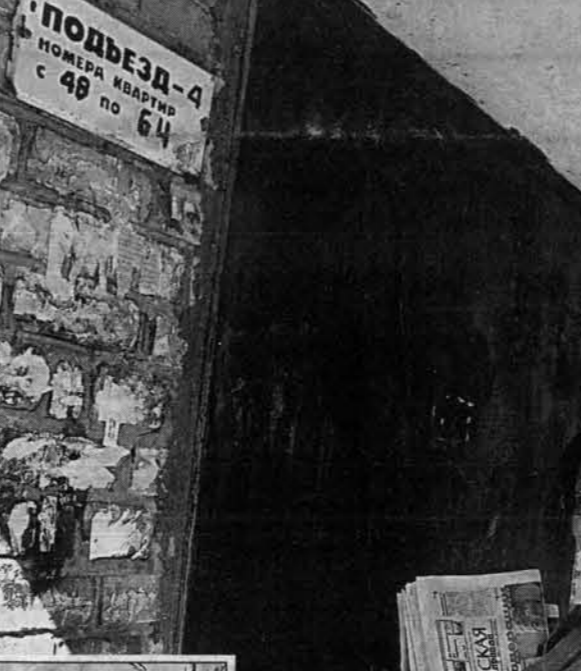
Всего в Управлении федеральной почтовой связи по краю работают 7797 человек, из них 3227 - почтальонов. На Барнаульском почтамте работают 1106 человек, а почтальонов в столице края 286.

Справка "АП": Всего в Управлении федеральной почтовой связи по краю работают 7797 человек, из них 3227 - почтальонов. На Барнаульском почтамте работают 1106 человек, а почтальонов в столице края 286. В трех Барнаульском почтамта по обработке почтовых отправок в сутки поступает более 70 тысяч писем (43 тысячи - из других регионов, 31 тысяча - из района). Все письма обрабатываются вручную. С помощью электропечки производится обработка ценных бандеролей и писем, посылок. В ближайшее время будет компьютеризирована обработка заказных писем.