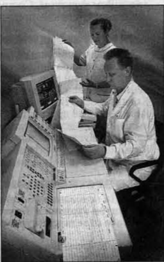
Медицина сегодня - это современное оборудование и технологии, плюс высококвалифицированный персонал.