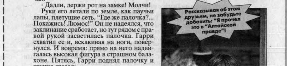
Рассказывая об этом друзьям, не забудьте добавить: "Я прочел это в 'Алтайской правде'!"