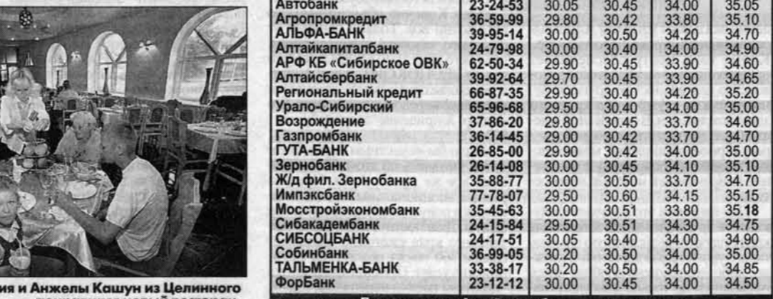
Новый ресторан и его территория украшают райцентр.