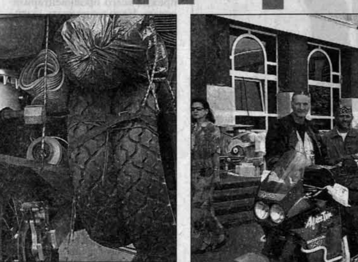
На каждый мотоцикл нагружено 90-100 килограммов поклажи. Номера, как видите, швейцарские, но никаких проблем с ГИБДД не было.