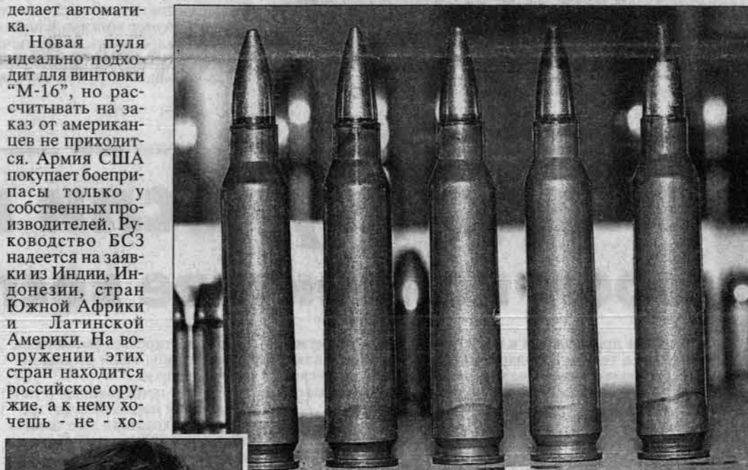
Тот самый "РС-101". Этот патрон пробивает даже боевые машины пехоты.

На Международной выставке военной техники, вооружения и технологий, которая проходила в Омске в июне, Барнаульский станкостроительный завод получил золотую медаль. Высшую награду нашим конструкторам присудили за разработку боевого патрона бронейного действия "РС-101". "РС-101" - патрон нового стандарта. Его массовое производство началось на БСЗ еще в прошлом году. Эти патроны подходят к автомату Калашникова 101-й серии, американской винтовке "М-16" и ее модификациям, а также к немецким и бельгийским пулеметам. Со ста метров "РС-101" пробивает сталь толщиной в шестьдесят миллиметров. Поражающий эффект пули настолько высок, что от нее не спасут никакие каски и бронезилеты. Патрон прошел не-