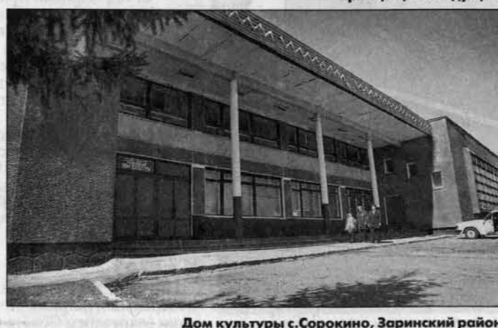
Дом культуры с.Сорokino, Заринский район.