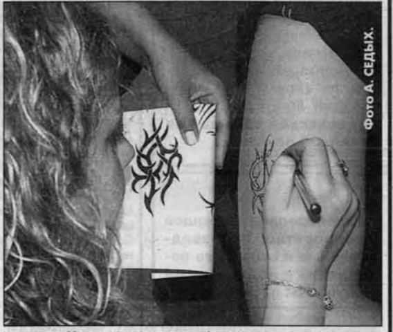
Ничего в моде марийские и алтайские узоры.