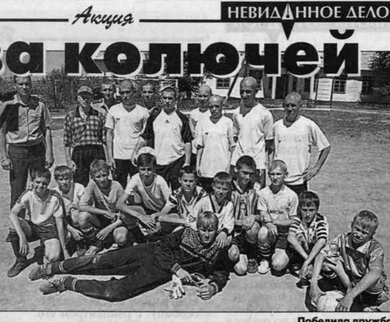
Победила дружба! Атакуют "New-центр"