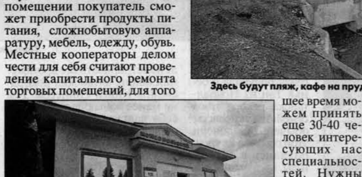
В "Комсомольском" всегда рады покупателям.