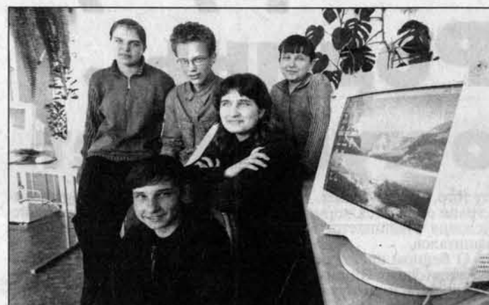
Компьютерный класс в Мамонтовской средней школе.