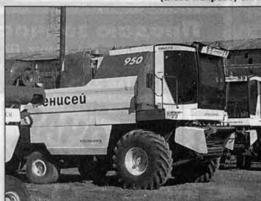
Разве это не красавец?