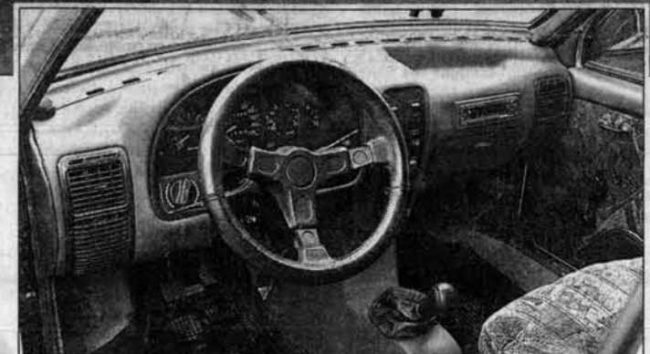
Теперь такая панель приборов будет в каждой малолитражке!

Вот так, дорогие читатели, в каждой шутке и в самом деле есть доля истины. Те, кто звонил нам по поводу приобретения новой модели "Оки", теперь могут дожидаться ее появления.