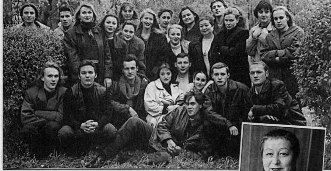
Курс перед выпуском.