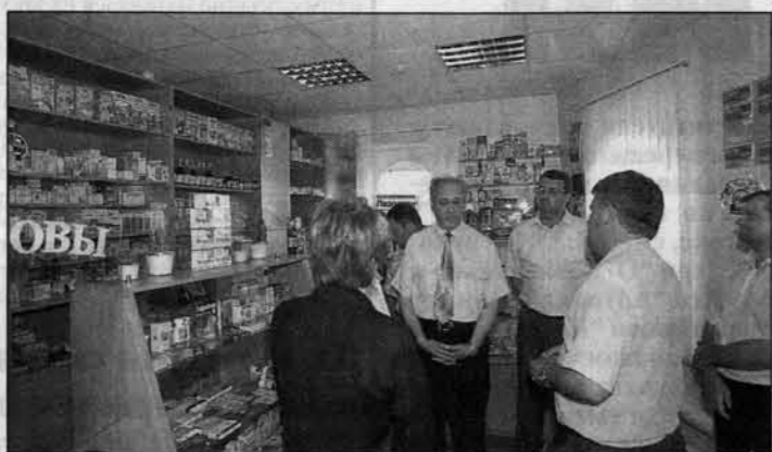
В аптеке райцентра хороший ассортимент.

лований и более полно задействовало бы медтехнику. Хотя