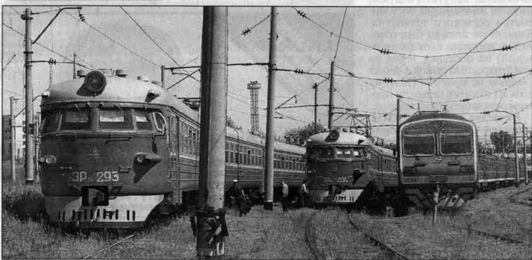
Электрички на ремонте... А могли бы возить людей.