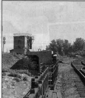
Здесь хулиганили подростки.

такие уже и маленькие - в поездах могут ехать и их друзья или родственники. Бывает, даже родители подростка работают на железной дороге, а он ходит разбить камни в поезда... Каждый раз, когда спрашиваем, зачем это делается, внятного ответа не получаем. Кто-нибудь один предложит, а остальные согласятся.