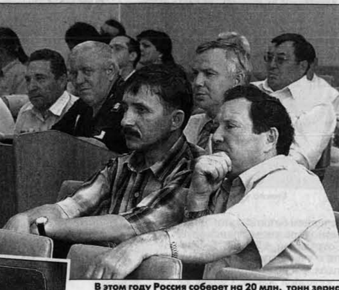
В этом году Россия соберет на 20 млн. тонн зерна меньше обычного. Есть от чего задуматься...

Есть чем гордиться Гости к нам приехали издалека: из Москвы, Санкт-Петербурга, Ярославля, Рыбинска, Твери, Архангельска и даже Мурманска. О своих сибирских соседях (Томск, Новосибирск и т.д.) и говорить нечего. Причины интереса самые прагматичные: просто у нас это дело поставлено лучше, чем где-либо еще. Предприятия в Алтайске и Рубцовске - лидеры отрасли по России. Каждый пятый килограмм крупы в России выработан на Алтае. 15 процентов российской муки - тоже алтайского производства. Продукция алтайских мельниц и крупяных развозится по всей России, вывозится в СНГ. Без особого преувеличения, Алтай кормит миллионы людей. На первый взгляд - картина динамичного развития.