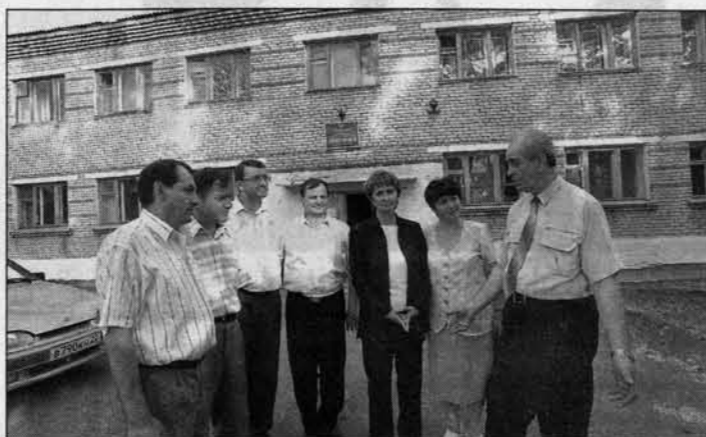
Хорошая поликлиника - это не только аппаратура, но и грамотные специалисты.

агностики и лечебного процесса. При сегодняшней непростой финансовой ситуации в районах надо было бы размещать поликлинику и больницу на одной территории, что сократило бы количество необходимых иссле-