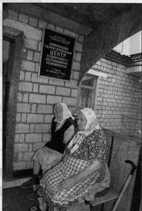
В социальном центре сегодня живут 30 ветеранов, а просятся еще 20.

на думает и о том, как приобрести жилье для специалистов. Ведь при существующем уровне оплаты труда врач или учитель вряд ли смогут приобрести дом