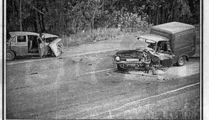
Машины - в хлам, но люди живы.

Четыре прошедших выходных дня ознаменовались большим количеством дорожно-транспортных происшествий на дорогах края.