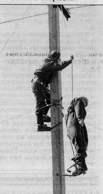
Вот так спасали "Гошу".

Программу конкурса составляли девять заданий: теория, спасение пострадавшего от электрического тока, замена дефектного изолятора, тушение пожара... Оценка - в баллах: за скорость, соблюдение технологий, четкость ответов, за качество спецодежды и т.д. Дополнительные поощрения за применение оригинальных технических приспособлений при выполнении операций.