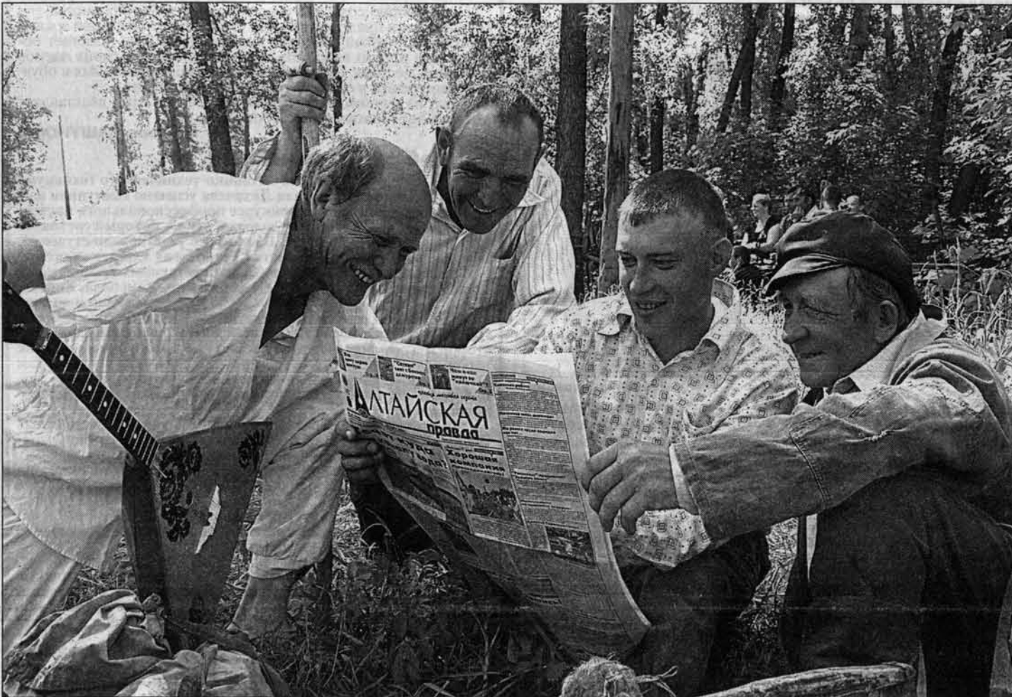
Мужская вокальная группа из села Сунгай Кытмановского района любит не только петь, но и узнавать новости от надежных источников.

До конца подписной кампании остались считанные дни. Большинство наших давних читателей (а таких - большинство, как говорится, от добра добра не ищут) уже давно побеспокоились о том, чтобы "Алтайка", с которой приятно "пообщаться" вечером после работы, чтобы узнать достоверные подробности о самых разных событиях, произошедших вчера и намерены в крае, в стране, в мире, приходила домой, как и прежде. Редакция ценит такое доверие и во втором полугодии 2003 года порадует читателей новыми интересными публикациями. Не изменяя своей основной концепции "трех О": объективно и оперативно обо всем. А тех, кто еще не определился, приглашаем: "Присоединяйтесь!" Десятки тысяч жителей края, начинающих