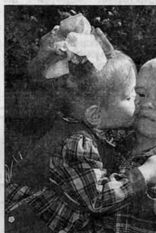
Уж эти мне девочки!