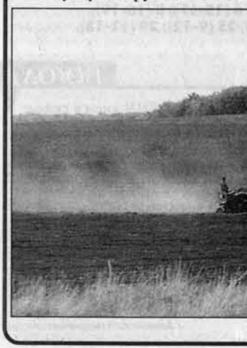
Шипуновский район: самсоновцы стараются.