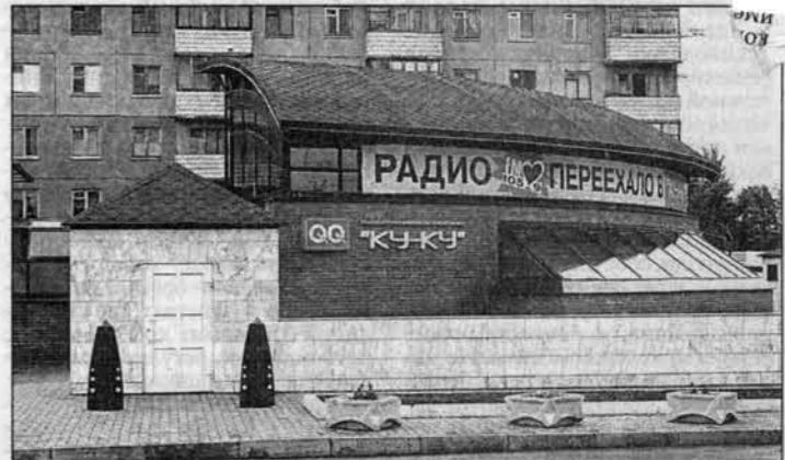
За этими стеклянными стенами бьется маленькое, но гордое сердце Барнаула!