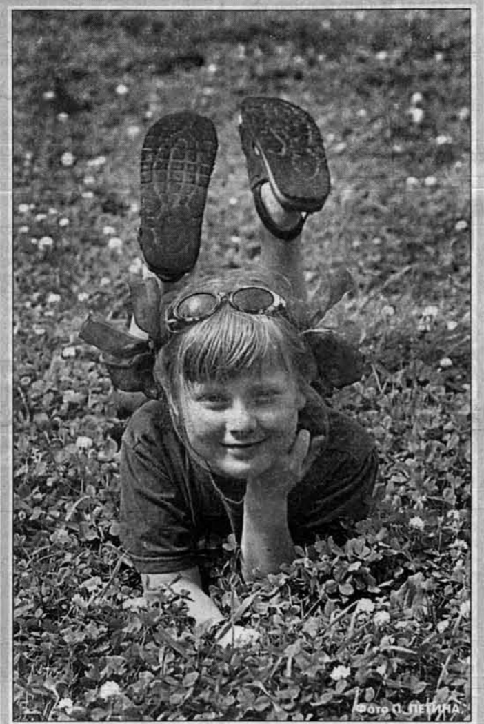
Завтра начнется лето. Бесконечные дни, наполненные солнцем, речкой, футболом и газировкой...