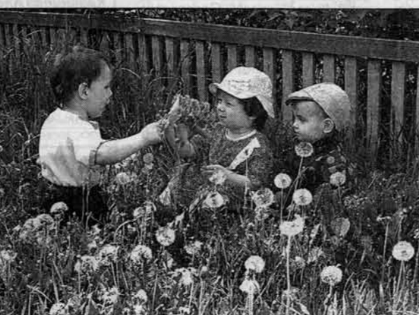
Первые весенние цветы, конечно, даме!

плачет все время, безостановочно, даже не плачет, а хрипит, как старичок. Потом нам доктор объяснила - это ломка, потому что мама у него - наркоман.