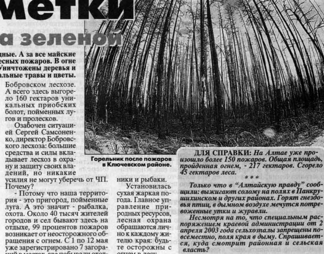
Горельник после пожаров в Ключевском районе.