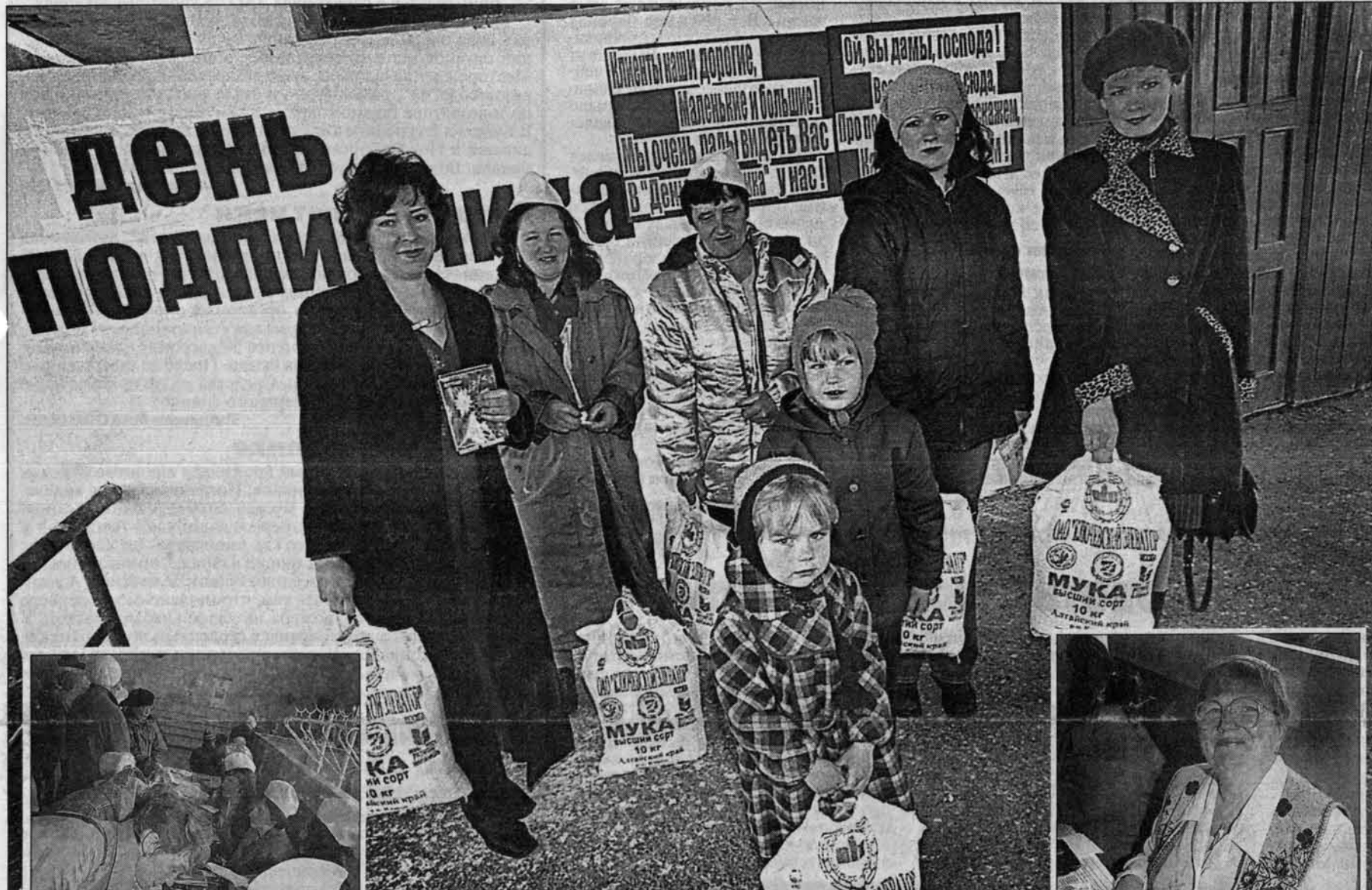
Традиционные призы от "Алтайки" и Ключевского элеватора (Ю.Титов) - десятикилограммовые упаковки высококачественной муки.

- Людмила! Иди скорее - тебе приз от "Алтайки" достался! - радостно кричали кытмановцы, собравшиеся в гостеприимном Доме культуры на День подписчика.