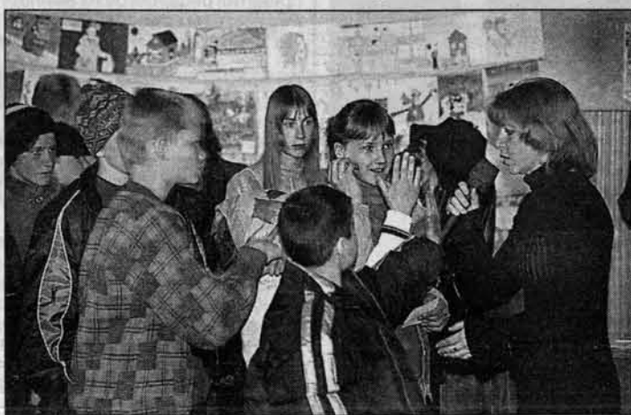
Работники районного Дома культуры помогают почтменам организовать праздник.

(Начало на 1 стр.) Кытмановский район - сравнительно небольшой, но периодики выписывает много, в лидерах по тиражам традиционно местная газета “Сельский вестник” и “Алтайская правда” - их популярность в районе и сегодня растет. Работники районного узла связи к подписным кампаниям относятся очень серьезно. Стараются дойти до каждого. Дни подписчика проводят не для галочки. Стараясь устроить праздник. В этом им здорово помогают работники районного Дома культуры: не просто пускают под свою крышу, но и актовый зал тематически оформляют, концертную программу готовят, раз-