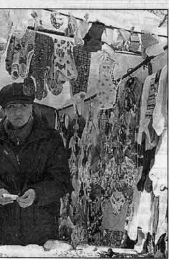
Маленькие детки - маленькие бедки...

ню коляску, а третью украла прямо из подъезда, с грязными колесами. Оказалось, что она занималась перепродажей колясок. И говорила, что жила припеваючи. Сейчас по продаже колясок б/у есть даже фирмы. Цены на новые - до 10 тысяч рублей - позволяют иметь такой бизнес. А что же в магазинах? Сети "Детский мир" больше нет. Она распалась в начале 90-х. Из известных магазинов краевого центра почти полностью детским остался лишь на улице Советской. В "Смене" уцелело по отделу одежды и игрушек. В бывшем "Детском мире" на Исакова - то же самое. Магазин "Солнышко" после ремонта светит детям только одной половиной. Их сменили новые магазинчики и отделы в маркетах всех пошшибов. Заявка на детскую "фирму" в них, впрочем, относительна. С одеждой еще туда-сюда, а обувь - только из дерматина "made in China". А ценники! В одном таком отделе дешевле 500 рублей обнаружил лишь подтяжки (за 270 рублей) и носки (за 80 рублей). Джинсовые рубашки на моего четырехлетнего малыша дороже, чем на меня. При этих ценах располагать детские отелы рядом с аптеками, что слышно и рядом бы-