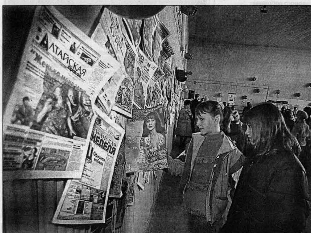
Изданий сотни, какое выбрать?

(Начало на 1 стр.) Кытмановский район - сравнительно небольшой, но периодики выписывает много, в лидерах по тиражам традиционно местная газета “Сельский вестник” и “Алтайская правда” - их популярность в районе и сегодня растет. Работники районного узла связи к подписным кампаниям относятся очень серьезно. Стараются дойти до каждого. Дни подписчика проводят не для галочки. Стараясь устроить праздник. В этом им здорово помогают работники районного Дома культуры: не просто пускают под свою крышу, но и актовый зал тематически оформляют, концертную программу готовят, раз-