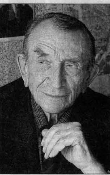
Стаж - полвека. С гонимым