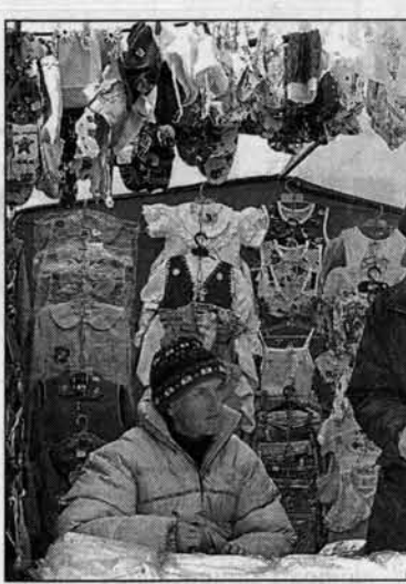
На базаре все равно дешево.

Мальчик с девочкой дружил... Года два назад начала продавать вещи подросткового сына. Первое объявление в местной газете было без телефона, только с адресом и именем - Надежда. Встретились. Женщина лет 45-ти. Трехмесячную "виновицу" объявила кормил из бутылочки мальчишка лет пятнадцати. От первой-то внучки - дочери старшего сына - у нас ничего не осталось. Она большая уже. А тут вот оно, горе, одевать да кормить надо... - Еше родили? - предположила я. - Да вы что! Это не дочка мне. Вот младший оболтус подружился-подружился, а она родила от него и ребенка бросила. Он говорит мне: мам, давай заберем. Я подумала-подумала да и забрала. М-да, бывает всякое... Кто покупает и кто продает Кто еще покупал у меня вещи? Две 17-летние девочки, одна из которых родила двой-