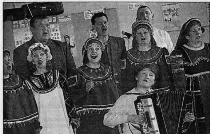
Какая песня без баяна, какая пресса без “АП”!