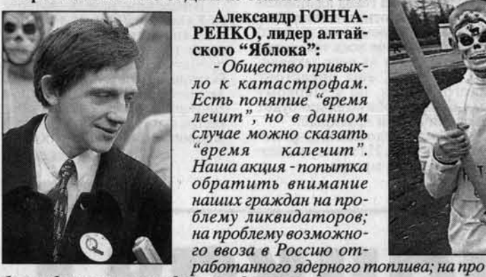
Зрелище было не для слабонервных.

По Ленинскому проспекту прошла колонна людей в белых халатах и в уродливых масках. Таким образом активисты партии "Яблоко" решили напомнить людям об аварии на Чернобыльской АЭС. Да и не только об этом.