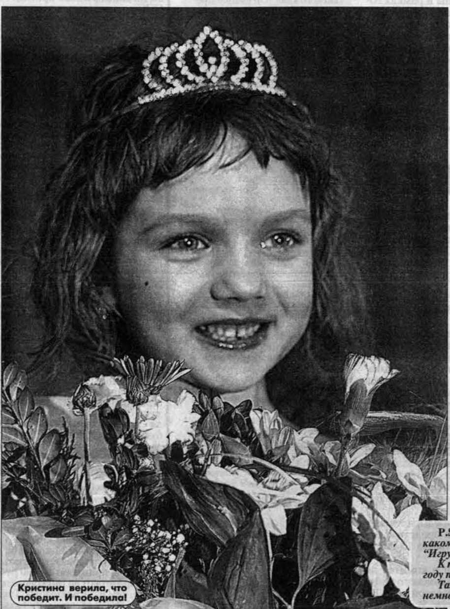
Кристина верила, что победит. И победила!