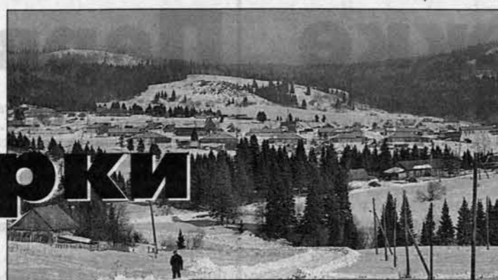
В Лазурке красиво и летом, и зимой.

Лазурка для Змеиногорска, как Затон для Барнаула - поселок муниципального подчинения. Но если затонцы на городском автобусе до краевого центра за 15 минут добираться, то лазурцам на редких попутках до своей столицы долго киселя хлебать, а в свирепые бураны и вовсе ходу нет.