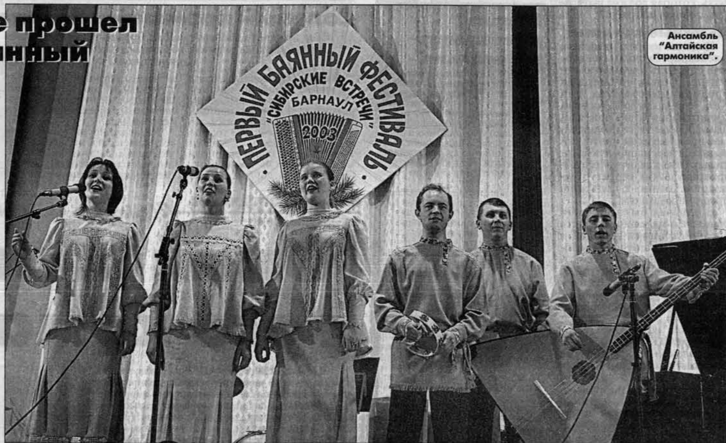
Ансамбль "Алтайская гармоника".

Невиданный по содержанию и эмоциональной насыщенности гала-концерт состоялся в минувшее воскресенье в зале АГИИКа. Это был заключительный аккорд четырехдневного музыкального марафона - первого в Барнауле баянного фестиваля "Сибирские встречи", организованного по инициативе музыкантов оркестра "Сибирь".