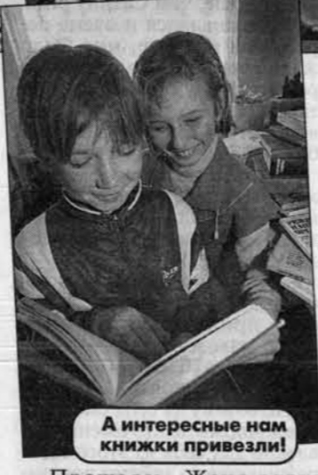
А интересные нам книжки привезли!