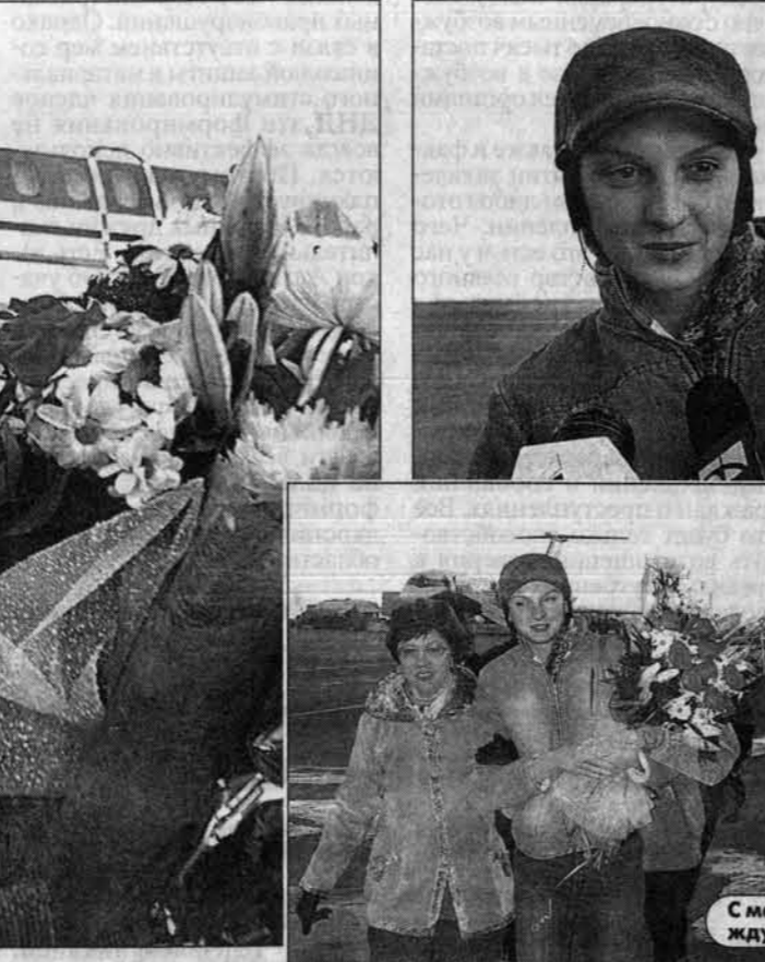
С мамой. Блинчики с творогом ждут чемпионку!

25 марта в Барнауле прилетела Татьяна Котова, теперь уже двукратная чемпионка мира по прыжкам в длину.