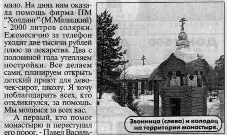
Звонница (слева) и колодец на территории монастыря.