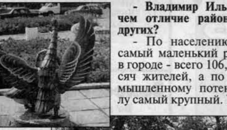
Парк "Солнечный ветер".

Конечно, жалость. В последнее время там работало 1200 человек, а сегодня осталось около 250.