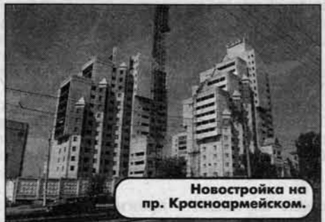
Новостройка на пр. Красноармейском.