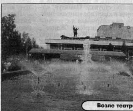
Возле театра драмы.

Многие предприятия района в последние годы находят резервы для своего развития. На "Алтайхолоде" заканчивается строительство второго цеха мороженого.