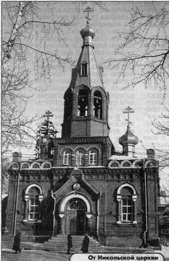
От Никольской церкви до революции после молебна отправлялись на войну наши земляки.