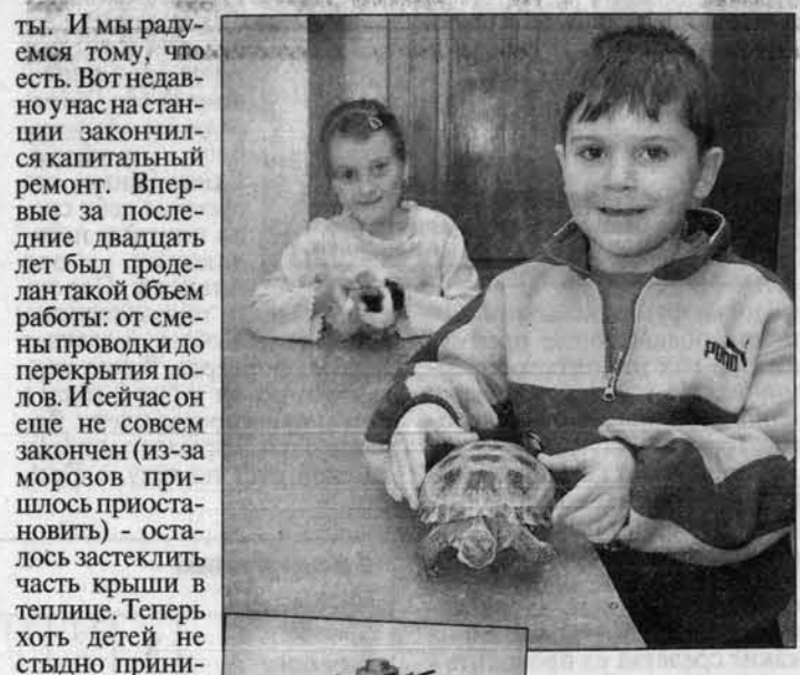
Ученики в объединении юннатов.

Диких животных мы стараемся медленно отпускать, - говорит Валентина Витальевна. - Они тоскуют в неволе, да и просто нет у нас возможности их содержать. Те же ежи - хищники, им мясом нужно, а где его взять в достаточном количестве? Правда, к нам не только педагоги, но и ребята с пустыми руками редко приходят. Кроме того, наше помещение располагается на первом этаже школы N 106, и держать здесь большое количество диких животных мы просто не имеем права. Да, когда-то на станции (в улочных вольерах) жили индюки, и павлины, и даже шакалы, но после многочисленных жалоб окрестных жителей от этих животных пришлось отказаться. Вот если бы у нас было свое здание... Но пока это одни меч-