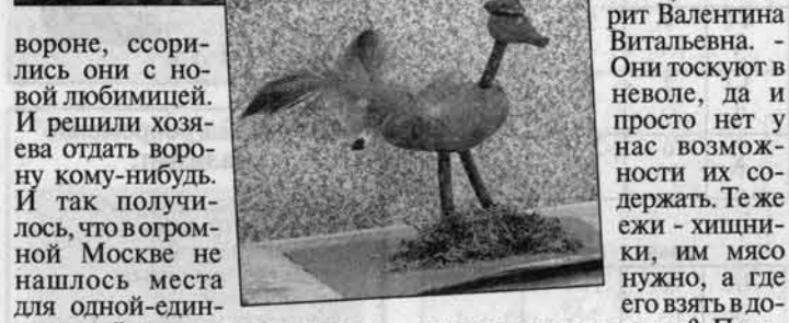
Ворона, ссорилась она с новой любимицей.

А дети на городскую станцию юннатов приходят и приезжают со всего Барнаула. А на канікулах здесь побывали ребята из Кулунды, Усть-Пристань, Бийска... Но это гости, а вообще-то на станции работают 12 объединений, в которых занимаются до шестисот ребят. И любой может найти свое дело по душе. Педагоги условно делят себя все объединения на два вида: зоологический и дендрологический. К первому относятся объединения аквариумистов, зоологов, орнитологов и т.д., а ко второму: цветоводов, флористов... Интересно, что иногда не угадаешь, чему отдают пред-