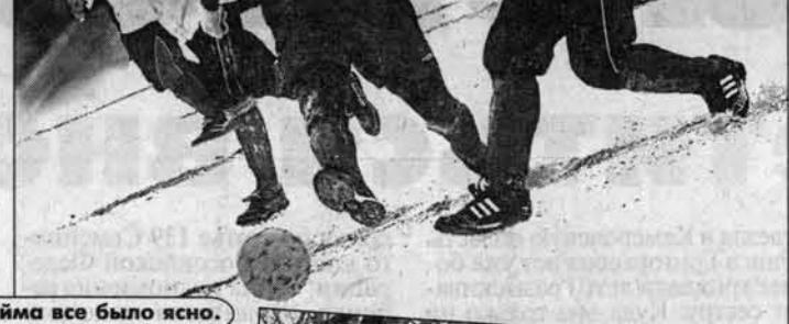
Уже после первого тайма все было ясно.

Вчера на барнаульском стадионе "Трансмаш" стартовал международный турнир по футболу на снегу на призы администрации города.