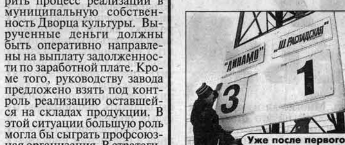
Уже после первого тайма все было ясно.

Вчера на барнаульском стадионе "Трансмаш" стартовал международный турнир по футболу на снегу на призы администрации города.