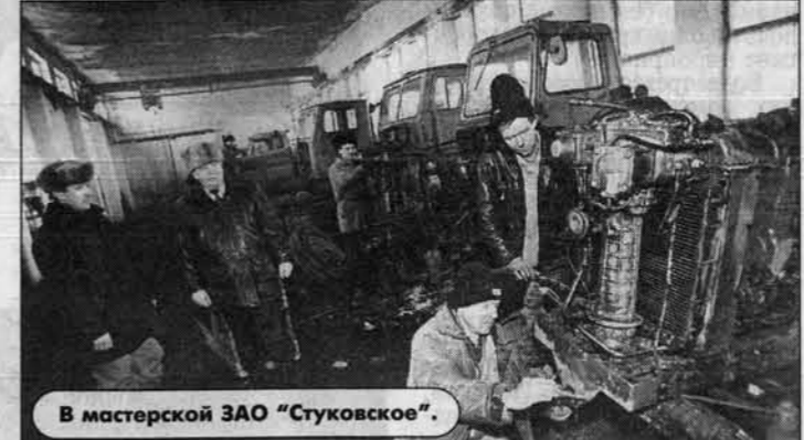
В мастерской ЗАО "Стуковское".