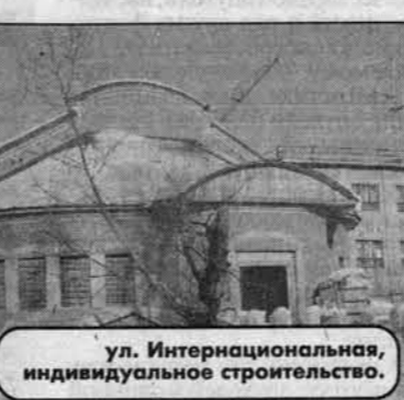
ул. Интернациональная, индивидуальное строительство.

Большую реконструкцию провели на "Силикатчике", где установлено немецкое оборудование, при помощи