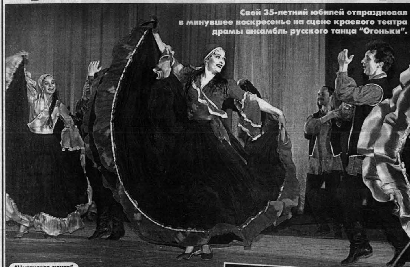
Свой 35-летний юбилей отпраздновал в минувшее воскресенье на сцене краевого театра драмы ансамбль русского танца "Огоньки".