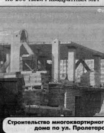
Строительство многоквартирного жилого дома по ул. Пролетарской, 110.

Ввод жилья, что требует больших затрат и усилий всех городских служб. Продолжается реализация двух крупных государственных программ "Жилище" и "Свой дом". В последние годы удавалось вводить по 200 тысяч квадратных мет-