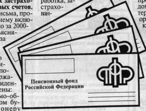
Пенсионный фонд Российской Федерации

дуются на конвертах; - сама распечатка, содержащая сведения о всех видах заработной платы, застрахованного лица;