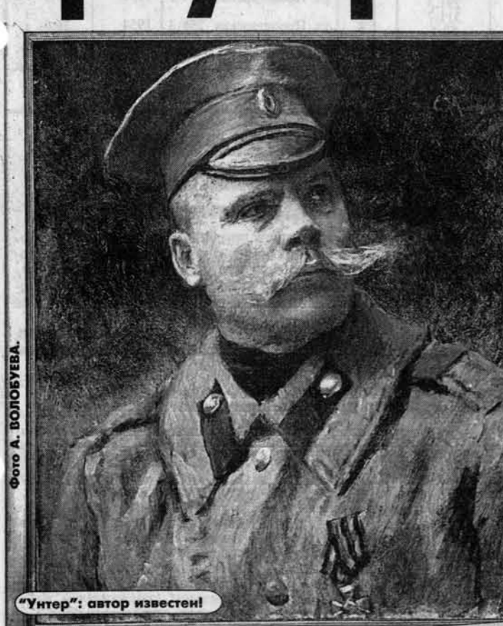
"Унтер": автор известен!

Наша справка Маковский Константин Егорович (20.06.1839-17.09.1915 гг.) - известный русский живописец, брат В.Е. Маковского, член-учредитель товарищества Передвижников. Создал ряд правдивых портретов, в 60-70-е годы обращался к сюжетам из народной жизни. Одна из самых известных картин К.Маковского - "Дети, бегущие от грозы" (1872 год, Третьяковская галерея, Москва).