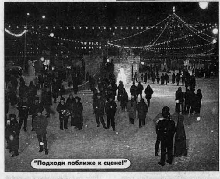
"Подходи поближе к сцене!"