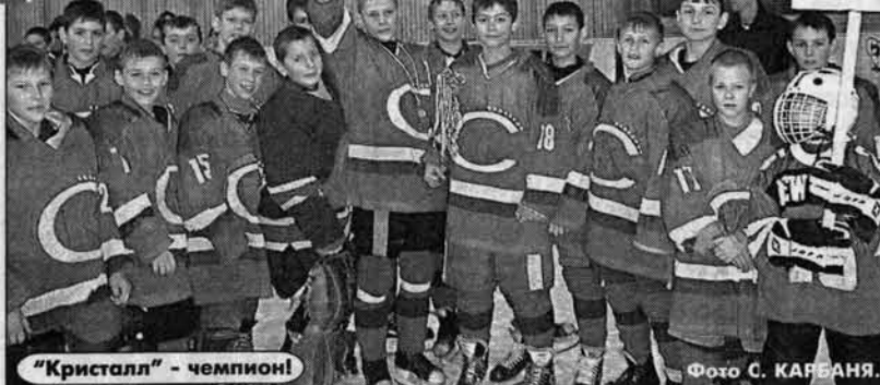
"Кристалл" - чемпионы!

Команда Доктевского района на первом этапе в краевом финале "Золотой шайбы" и сразу себя неплохо проявила. Проиграв в предварительном турнире две