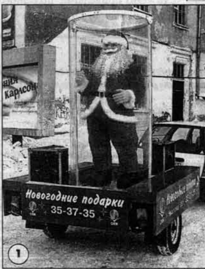
Новогодние подарки 35-37-35