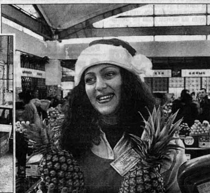
5. КАКОЙ НОВЫЙ ГОД без снеговиков и прочих сказочных героев...