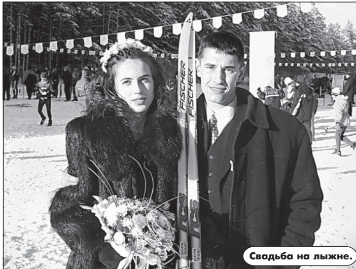
Свадьба на лыжне.