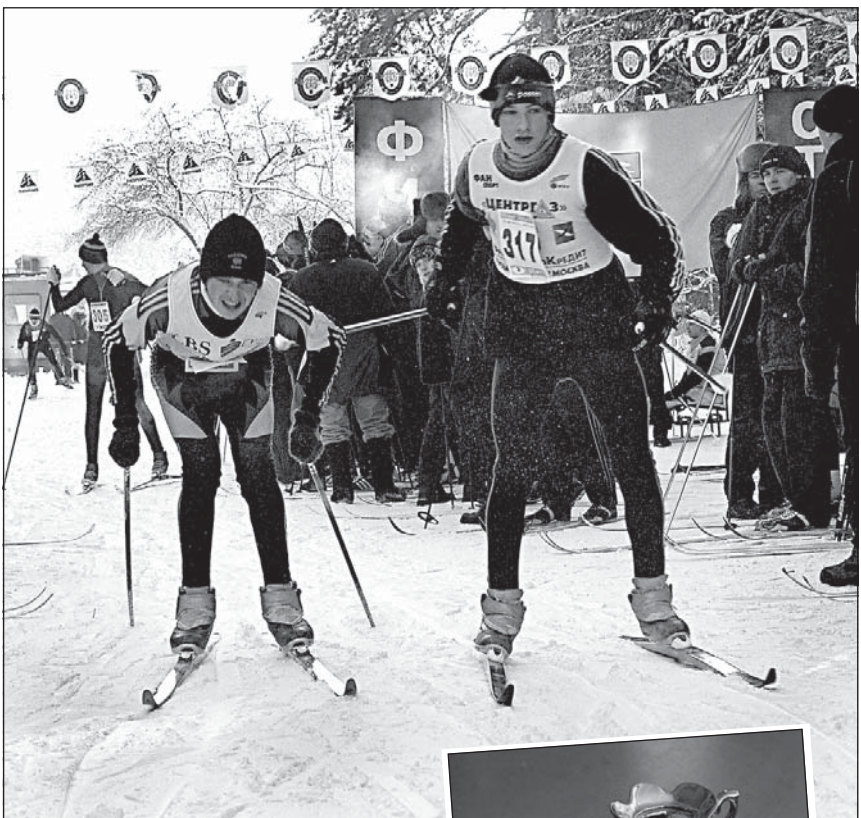
(Начало на 1 стр.)