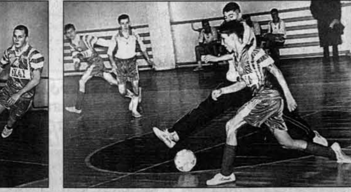
ВЕСТИ ИЗ РУБЦОВСКА