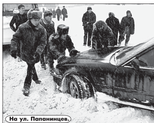
На ул. Папанинцев.