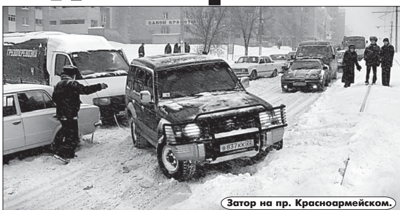
Затор на пр. Красноармейском.

В пятницу, 29 ноября, Барнаул, оказавшись в центре циклона, был буквально засыпан снегом. Метель началась с вечера 28 ноября, однако ничто не предвещало неожиданности. То-то же удивились горожане, пытаясь утром выйти из своих подъездов - громадные сугробы буквально запирали двери!