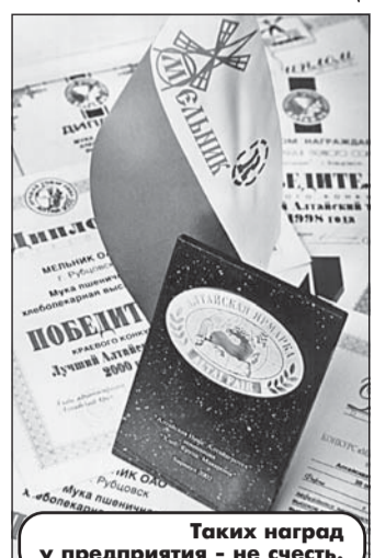
Таких наград у предприятия - несть.

ют потребителя. Значит, снижая себестоимость, совершенствуя производство - и так до