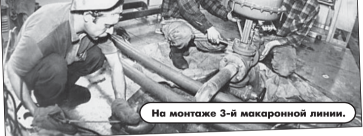
На монтаже 3-й макаронной линии.

ют потребителя. Значит, снижая себестоимость, совершенствуя производство - и так до