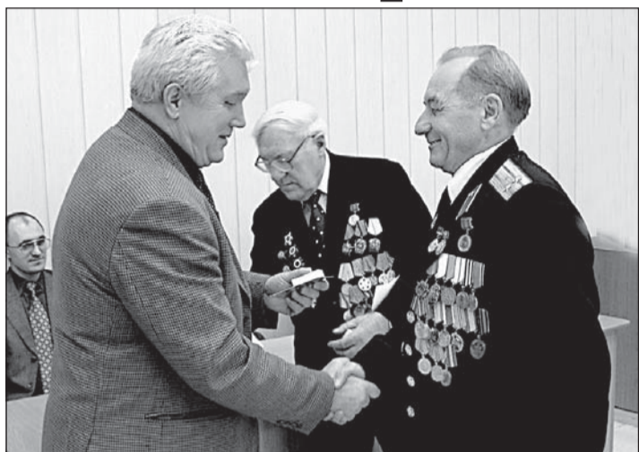
Во вторник в большом зале администрации края состоялась встреча ветеранов-фронтовиков, участвовавших в Сталинградской битве.