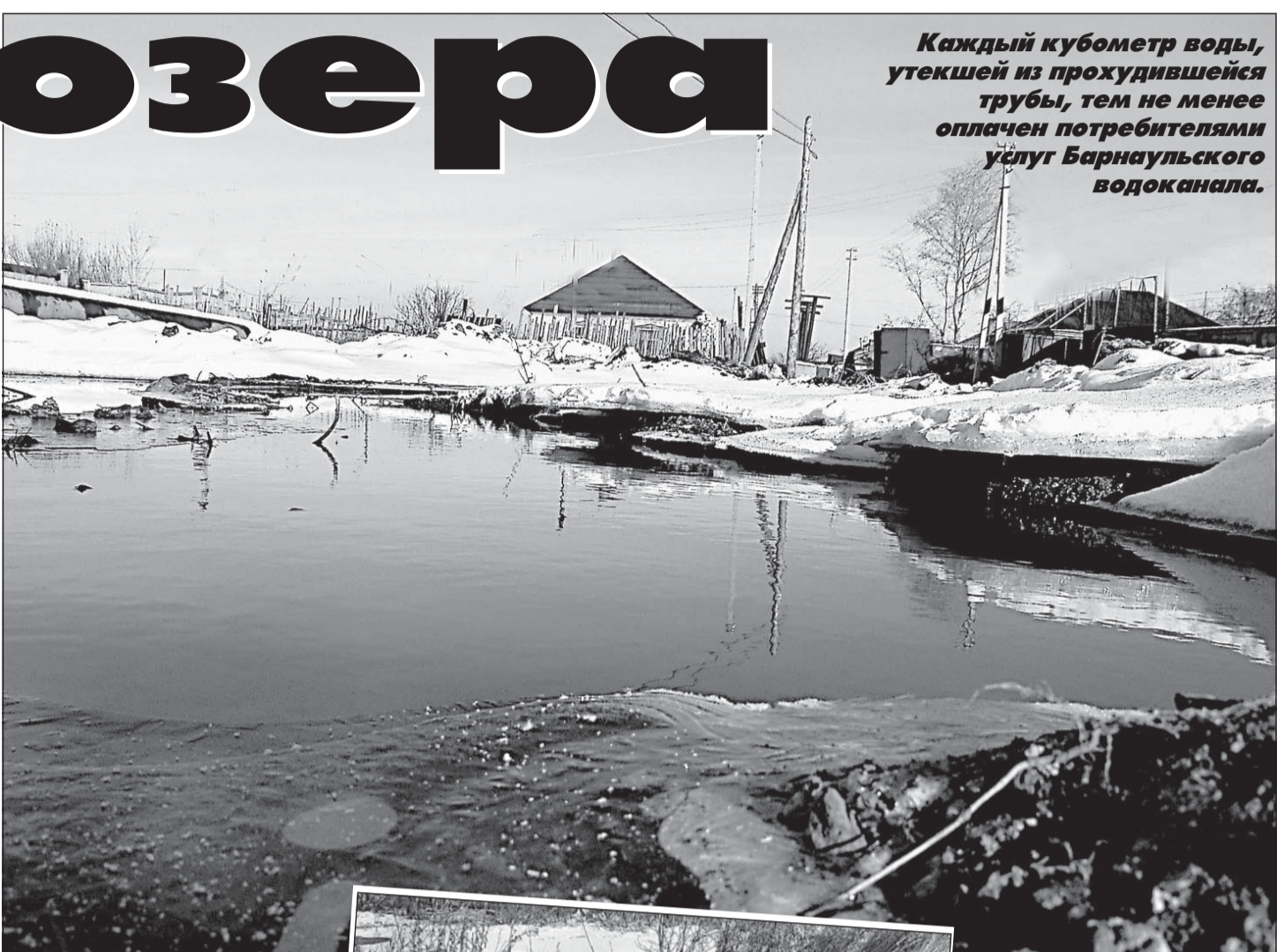
Каждый кубометр воды, утекшей из прохудившейся трубы, тем не менее оплачен потребителями услуг Барнаульского водоканала.