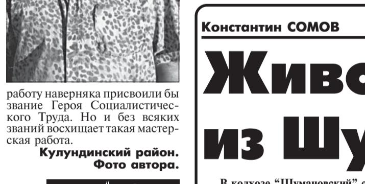
Кулундинский район.