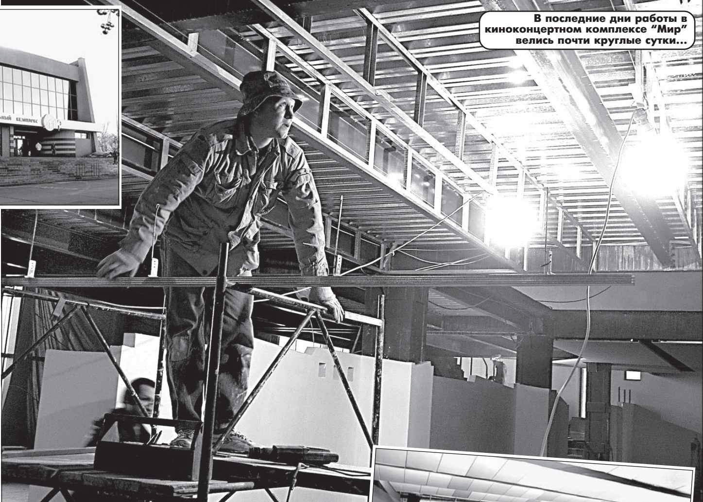
В последние дни работы в киноконцертном комплексе "Мир" велись почти круглые сутки...

В барнаульском киноконцертном комплексе "Мир" ведутся последние приготовления перед открытием. Первые зрители войдут в реконструированное здание 7 ноября. Первым фильмом, который посмотрят барнаульцы в обновленном зале, будет мировая новинка "XXX" ("Три креста"). А потом — суперремьера: фильм "К-19", рассказывающий о подвиге наших моряков-подводников.