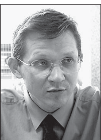
предстоят огромные выплаты по внешним долгам?

- Ответ на этот вопрос лежит скорее в политической, чем в экономической плоскости. В Думе - правительственное большинство, которое не любит вступать в споры с испол-