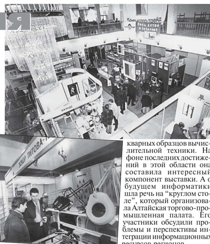
технологий на рабочие столы.