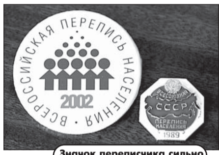
Значок переписчика сильно "подрос" с 1989 года.