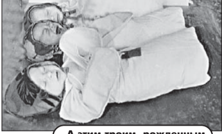
А этим трем, рожденным 9 октября, придется пожить неписанными...