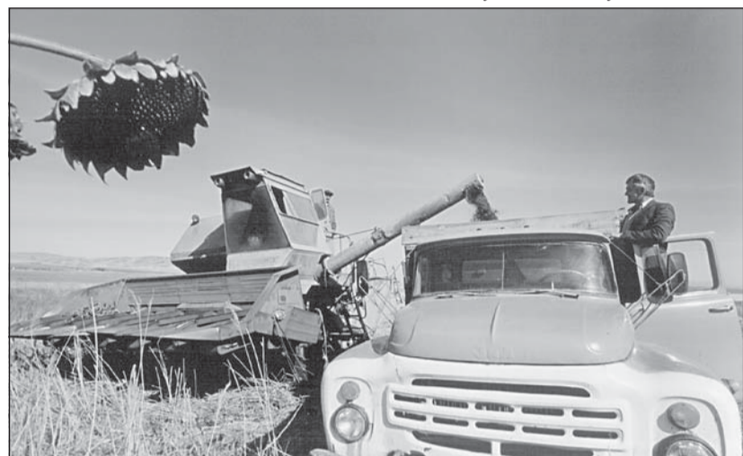
Итогов кормов много - и за год на корову выйдут по 3500 килограммов молока.