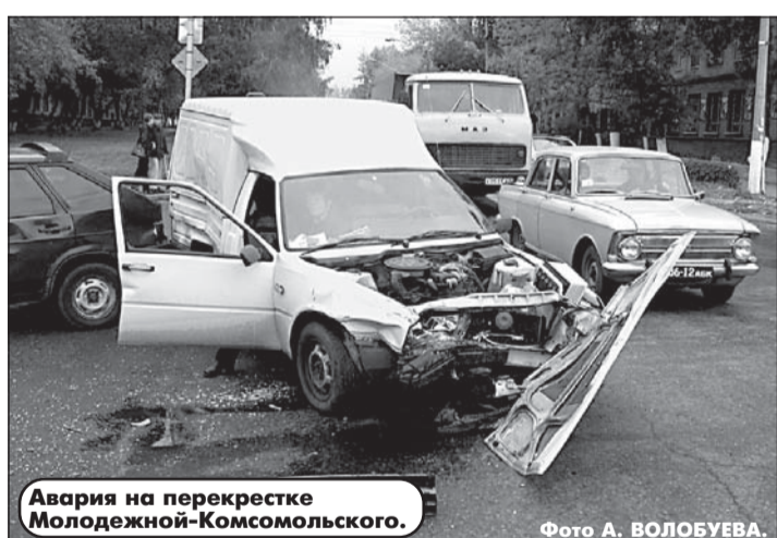
Авария на перекрестке Молодежной-Комсомольского.

Чем обширнее доказательная база, тем легче судье вынести правильное решение. Поэтому в ваших интересах контролировать действия со-