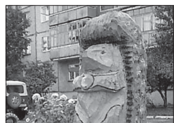
Редкие исключения: ул. Юрина, 204-а и ул. Исакова, 165

"Прошу помочь мне с деньгами на дорогу до Москвы и обратно для повторной операции на позвоночнике (злокачественная опухоль). Хозяйство я не держу, родных не имею, помощь на месте мне некому - отказали все, к кому я обращался. Люди добрые, помогите!" - читаем в письме жителя с Алтайского Алтайского района (ул. Советская, 180). Указан и личный счет в Сбербанке, но почему-то автор забыл назвать себя - нет ни имени, ни фамилии.