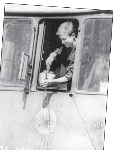
Первую электричку в крае железнодорожники запустили в 1965 году.

Он подает гудок, и мы трогаетесь. До Баюново ехать меньше двух часов, но останавливаться приходится через каждые 10-15 минут, ветка ведь садоводческая. И все равно хотя бы раз за маршрут кто-то да сорвет стоп-кран. В основном хулиганят мальчишки-малолетки, но чаще наши доблестные железнодорожные салодовы - лезть придется на высоту в десятки метров. И никто, наверное, не задумывается, какой переполох вывозят - машинисты не знают, что там произошло: пожар, кому-то стало плохо или кто-нибудь упал с подножки. В результате тратят нервы и время, пассажиры от резкого торможения получают ушибы, кроме того, это дополнительные нагрузки на оборудование, а оно и так изношено до предела.