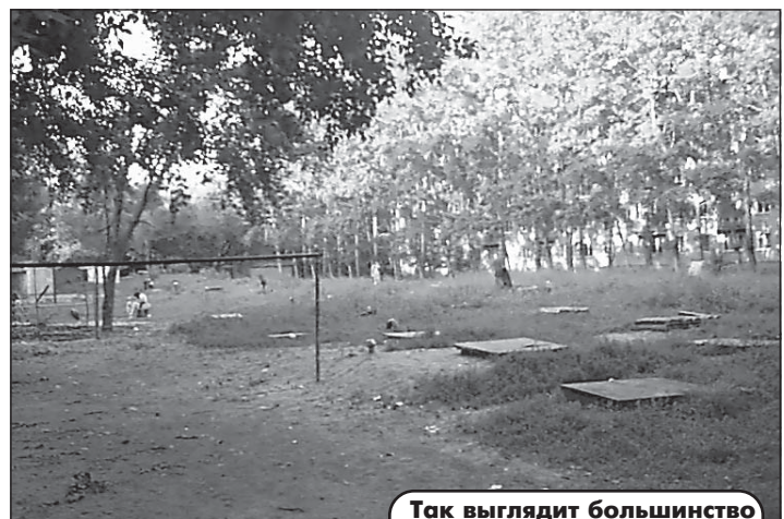
Так выглядят большинство детских площадок.

Объективности ради надо сказать, что даже на этих четырех образцовых дворовых площадках, которые Ленинский