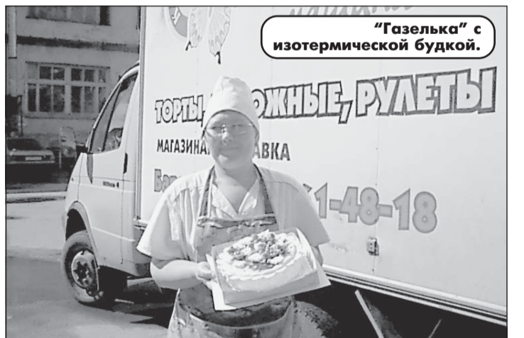
"Газелька" с изотермической будкой.