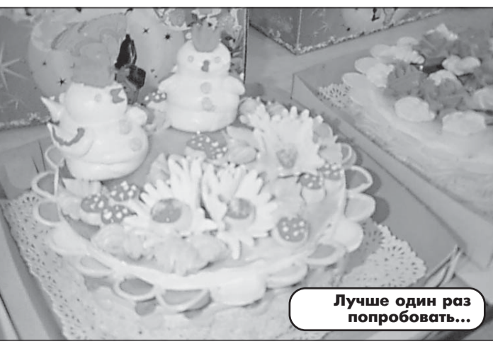
Лучше один раз попробовать...