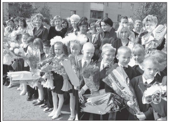
Просторный двор барнаульской школы N 127 с трудом вместил всех собравшихся на торжественную линейку.