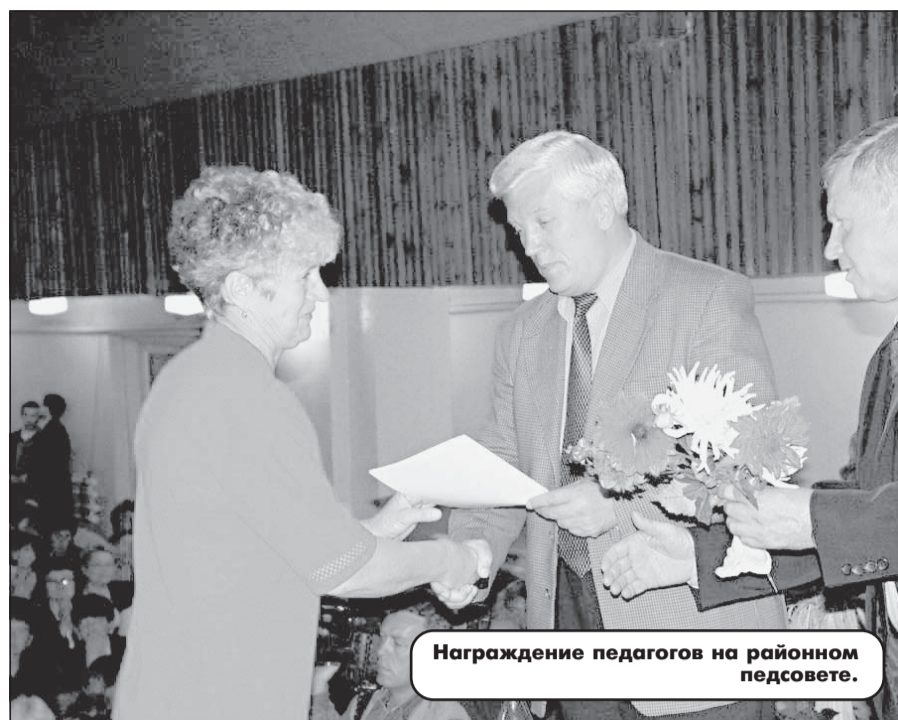
Награждение педагогов на районном педсовете.

Постановление от 02.09.2002 N 211 ОФИЦИАЛЬНО