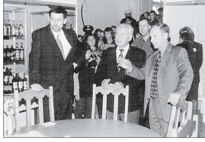
Накануне 65-летия образования края и в честь его в одном из крупнейших районов - Тальменском в минувшие пятницу и субботу прошел праздник района.

Первый день праздника был посвящен самому главному - подведению итогов в экономике и других отраслях. Была открыта большая выставка "Лучший товар района 2002 года".