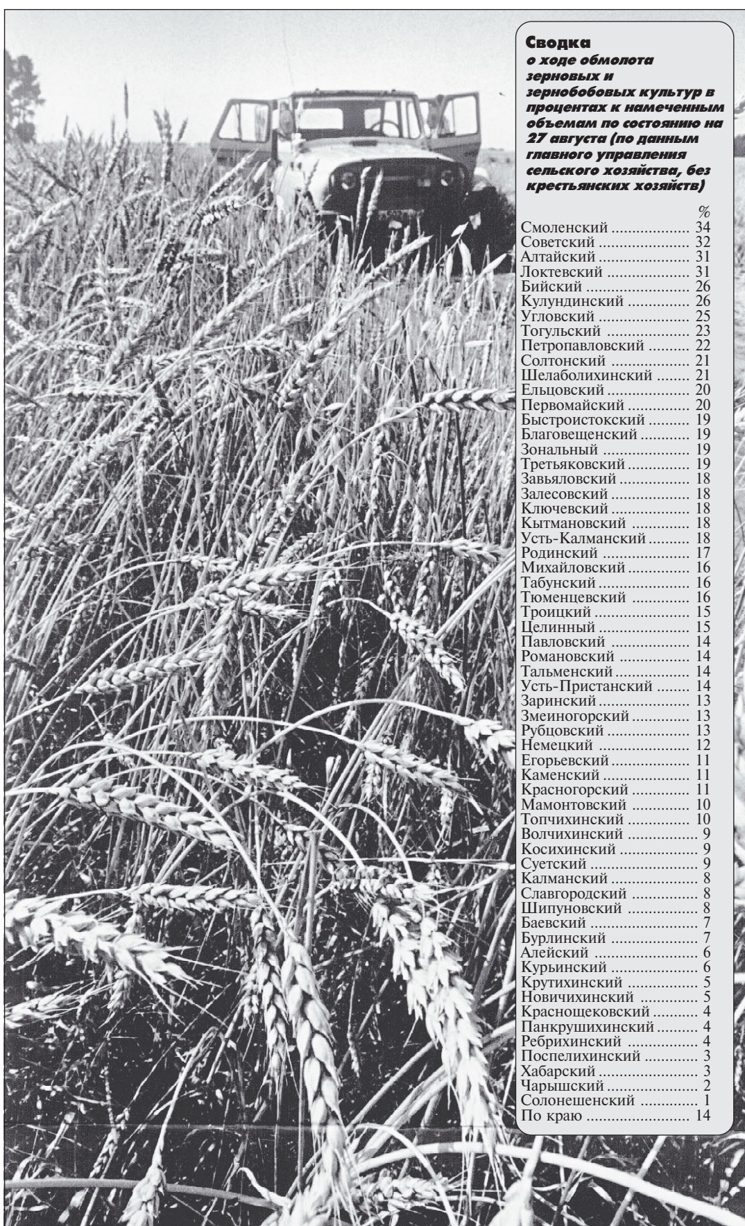
Сводка о ходе обмолота зерновых и зернобобовых культур в процентах к намеченным объемам по состоянию на 27 августа (по данным главного управления сельского хозяйства, без крестьянских хозяйств)

СЕГОДНЯ днем в крае и Барнауле переменная облачность, местами - дожди, грозы. Ветер юго-западный, умеренный.