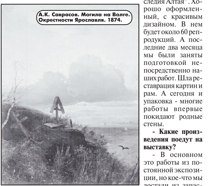
А.К. Саврасов. Могилы на Волге. Окрестности Ярославля. 1874.

писи не будет представлена. Мы покажем то, что было собрано за 45 лет существования нашего музея. В Москве будет представлено одно из тех полотен, с которых начался музей 45 лет назад, - парадный портрет Екатерины II кисти немецкого художника-классициста Рафаэля Менгса. Работа была передана нам Третьяковской галереей. - Есть среди произведений уникальные, редкие полотна? - Одно из самых выдающихся приобретений музея - коллекция произведений А.Саврасова. Мы повезем в Москву его пейзаж "Могилы на Волге", за которым в свое время охотились сотрудники Третьяковской галереи. Они его отследили, чтобы приобрести, и были в изумлении, когда увидели картину в на-