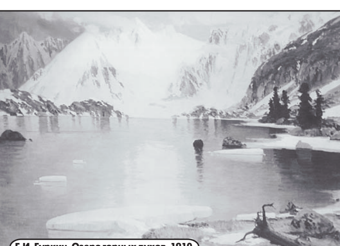
Г.И. Гуркин. Озеро горных духов. 1910.

- Это проект в каком-то смысле продолжает традиции художников-передвижников. Передвижники возили картины по России, а сейчас плоды их просвещения пожинает Третьяковская галерея. Во всех городах есть художественные