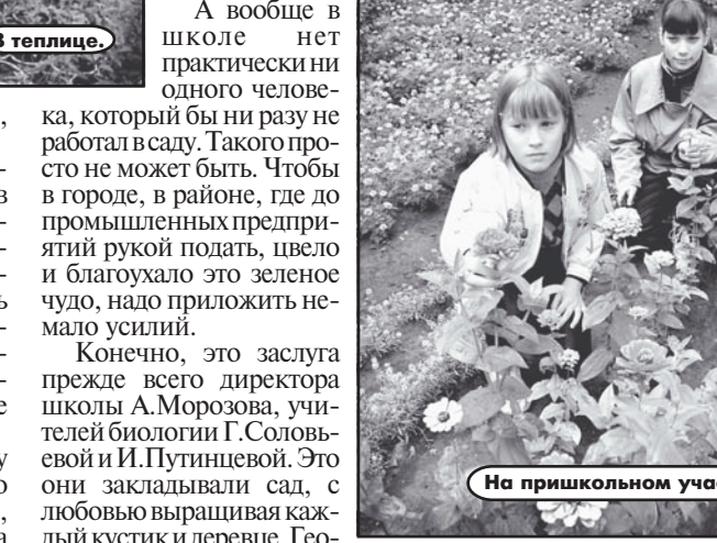
На пришкольном участке

недели отдают пришкольному участку. Даже самые ленивые очень быстро проникаются общей атмосферой дружной работы и быстро понимают, что трудятся они для себя, чтобы заработать от благоухающего сада энергии и бодрости. Дети любят свой сад, поэтому в нем царит чистота. К сожалению, весь мусор, регулярно, кстати, убираемый, оставляют в саду взрослые, гуляющие по территории. В этом учебном году в школе будет учиться почти 300 ребят. Что особенно радует - больше 20 первокурсников. Правда, немного меньше, чем в прошлые годы, но зато хорошая наполняемость в других классах. Не могу не отметить, что в школе хорошо развито самоуправление. У нас работает совет старшеклассников, разные детские объединения. И это не мы, учителя, а сами ребята держат школу, организуют досуг, решают много других проблем. К рассказу директора остается добавить, что успеваемость в школе стабильно держится на 98-99 процентов, выпускники с первого же захода поступают в вузы. Борис РОЖДЕСТВЕНСКИЙ.