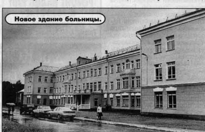
Новое здание больницы.