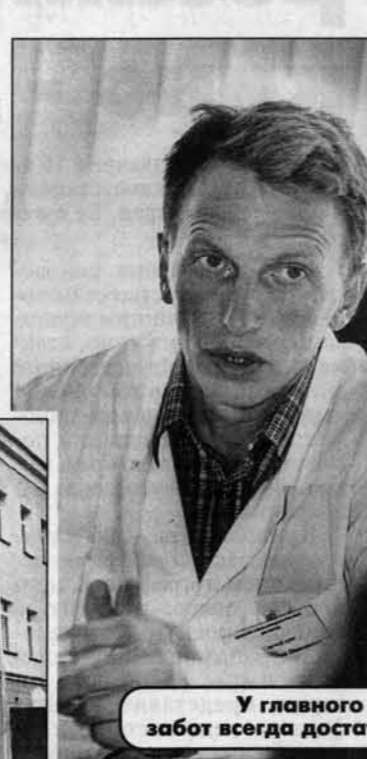
У главного врача забот всегда достаточно.

лектив не только ждал переезда диспансера в новое здание, но и приближал его. В последние месяцы практически все так или иначе "приложились" к уборке, благоустройству, наведению порядка. А то, каких усилий стоила