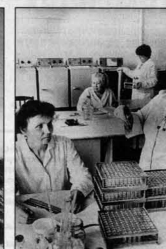
В лаборатории кипит работа.