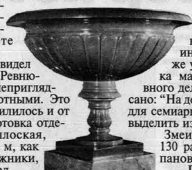
Чаша. Коргонский порфир. 1952 г. Изготовлена к 150-летию завода. Краеведческий музей.