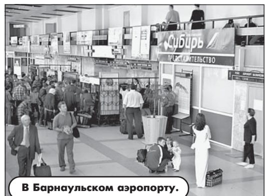
В Барнаульском аэропорту.

В чем секрет успеха? Скорее всего, в умении предвидеть и опережать конкурентов хотя бы на шаг, первыми найти ответы на трудные вызовы эпохи перемен. Когда доходы россиян упали до катастрофически малых величин, одним из главных инструментов выживания "Сибирь" стала гибкая ценовая политика. Когда другие действовали по принципу "нам бы лишь простоять да ночь продремать", здесь первыми поняли то, что позже осознали все: мелкие перевозчики не в состоянии содержать и обновлять парк воздушных судов, обеспечивая высокий уровень безопасности и сервиса. В тесном взаимодей-