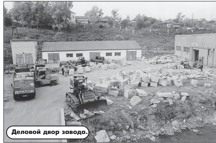
Деловой двор завода.

И вот здесь - в интервале 1998 года - вижу необходимость сделать небольшое отступление. Как бы ни впечатляли цифры долгов завода, есть еще реальная жизнь поселка Колывань, ядром которого был и остается камнерезный завод. Управление архивного дела администрации края в том году