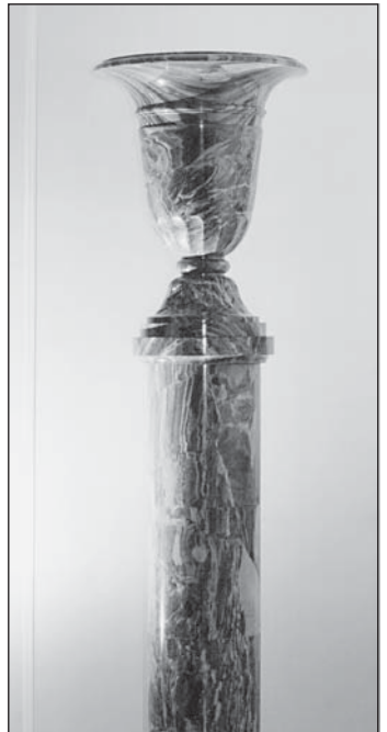
Ваза из ревневской яшмы. Коллекция музея "История дорог Алтайского края".