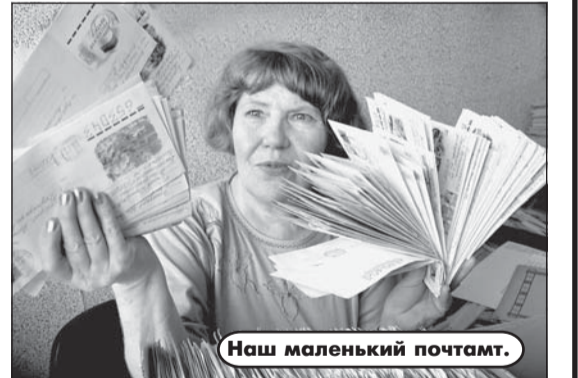
Наш маленький почтамт.

— Это еще что: в конце 1980-х получали по 24 тысячи писем в год, примерно по 200 в день. Тогда в отделе работало семь человек. Что и говорить, через отдел прошла прак-