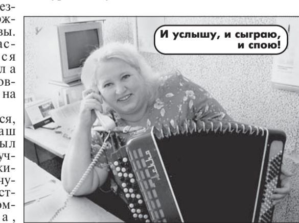
И услышу, и сыграю, и спою!