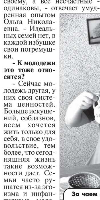
За чаем можно решить любую семейную проблему.