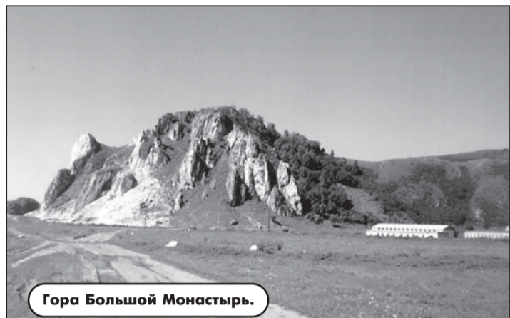
Гора Большой Монастырь.

Рядом с селом Усть-Пустынка, за рекой Чарыш, и сегодня видны следы двух Чарышских рудников. А на склонах горы отчетливо просматривается штрих копанца - дороги, выкопанной вручную для доставки извлекаемых руд