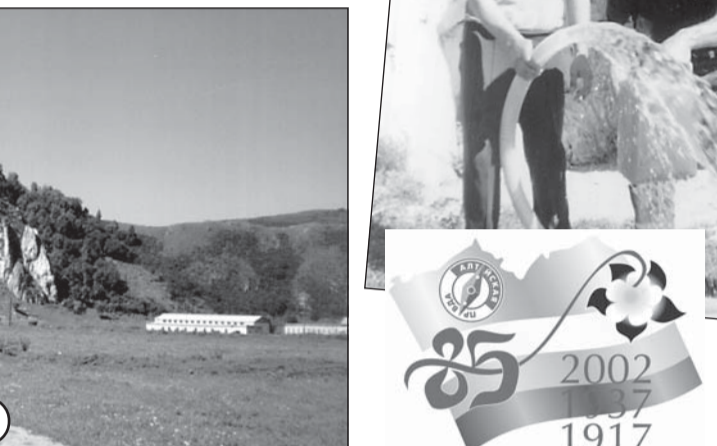
У пещеры Три Окна.

Судя по геологическим отчетам Рудно-Алтайской экспедиции, добыча берилла на Тигирекском месторождении драгоценных камней велась в 30-х годах прошлого столетия, а по другим источникам - еще с XVIII века. Известно, что у вершины горы Разработанной была пройдена вертикальная штольня длиной 18 метров и 14-метровая горизонтальная выработка. Всего