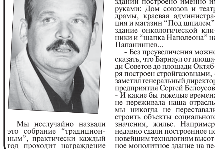
Мы неслучайно назвали это собрание "традиционным", практически каждый год проходит награждение

ресецинии улиц Петрова и Папанинцев. Добраваем детскую поликлинику на Влетной и школу в микрорайоне "Юбилейный". Ведутся работы (объект федерального значения) на здании краевой налоговой инспекции - оно будет самое высокое в крае. Хотелось бы принять участие и в прези-