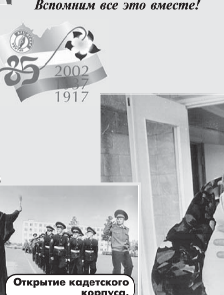
Открытие кадетского корпуса.