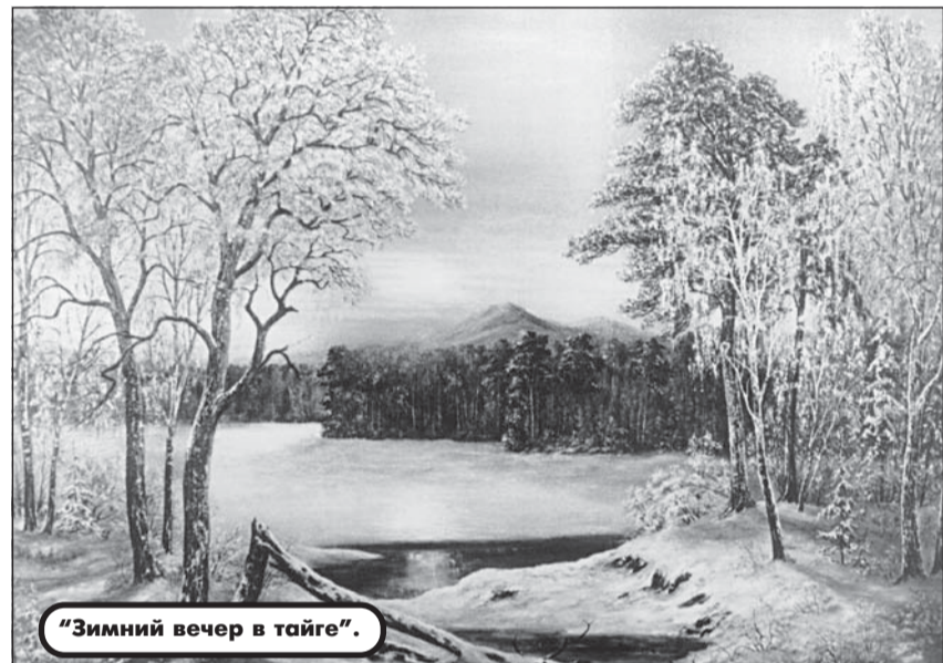
"Зимний вечер в тайге".