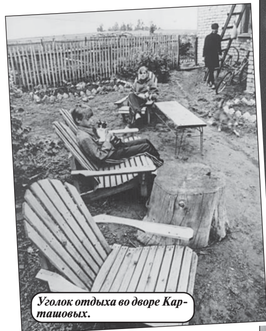
Уголок отдыха во дворе Карташовых.