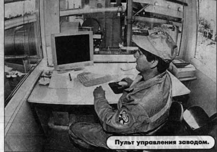
Пульт управления заводом.