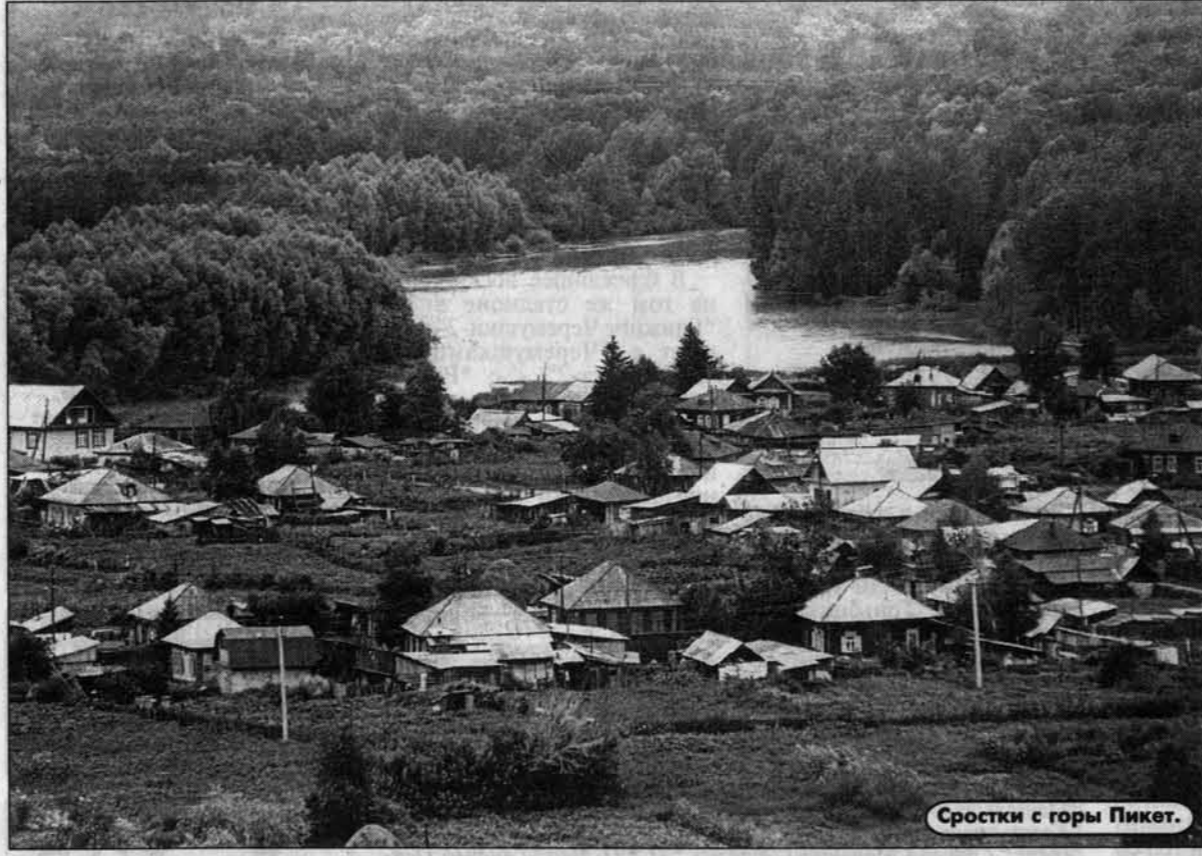
Сторжки с горы Пикет.

здесь, среди тех, кто пришел поклониться светлой душе Василия Макаровича Шукшина. К чтением я готовился, написал сочинение. Кстати, последний раз я сочинение писал при поступлении в Ленинградский горный институт. Писал искренне - если кто не так, не обессудьте. Мне кажется, истоки неувыдающей славы Василия Макаровича в том, что он мастер глубоко национального. Он в своем творчестве воссоздал самое сердце наших Шукшиных, как и его любимым героем Степан Разин, вышел из глубин народных. Отсюда такой искренний, терпкий, колоритный,