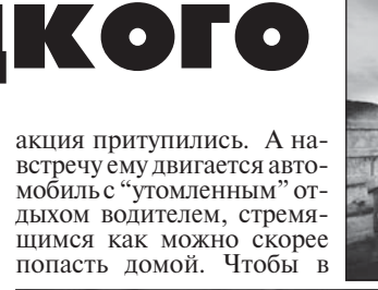
акция притупилась. А навстречу ему движется автомобиль с "утомленным" от дальним вождением, стремящимся как можно скорее попасть домой. Чтобы в

- Объяснение (но не оправдание) недостатков в нашей работе, конечно, есть. Наступил сезон отъезда, по Чуйскому тракту на огромных скоростях мчатся автомобили. Федеральная дорога дает нам большинство ДТП. И чаще всего участниками их становятся не местные жители. Самая распространенная схема ДТП такая: люди едут отъезжая из Барнаула, Новосибирска, Кемерово или даже Москвы в Горный Алтай. Водитель уже много часов, а то и дней находится за рулем, почти без остановок, внимание и ре-