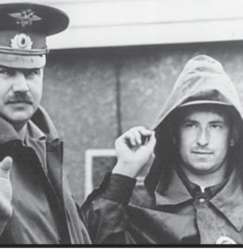
В почти столько же, сколько в Троицком, проведана начальником Суэцкого района? - В Троицком - сложнее. Суэцкий район - меньше, его весь за дежурство можно объехать, в стороне от больших дорог, меньше транспорта.

- Не тянет вернуться туда, где спокойнее? - Нет, здесь уже есть какие-то наработки, притерлись с ребятами друг к другу, коллектив у нас молодой, перспективный - жалко все оставлять.