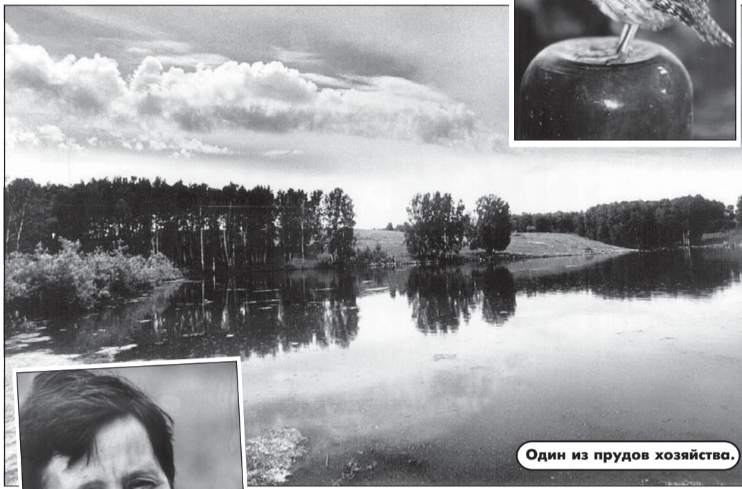
Один из прудов хозяйства.

В белке этих чудо-яиц зафиксировано высокое содержание золотых яиц, при промышленном разведении долго жить не способна. Содержит ее менее года, потом это становится уже экономически невыгодным. В течение полутора года самка способна принести до 250 яиц, после чего ее организм приходит в полное истощение. Представьте себе, какой у нее обмен веществ! Столько сил приходится затрачивать ради великого дела - продолжения рода. Для сравнения: фазан - куда более мощная птица - способен дать пятьдесят яиц в год. Но перепелке нужны стабильная температура - 18 градусов