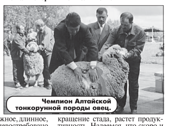
Чемпион Алтайской тонкорунной породы овец.