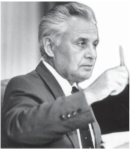
Состоялась 26-я сессия краевого Совета народных депутатов. В повестке дня было тридцать вопросов.