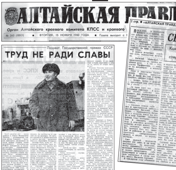
Почётный Государственный работник СССР Виктор Фелорович Рехлин...