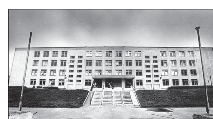
НА СНИМКАХ: выпускники 11 "в" класса (кл. рук. И. Глузова) готовят ответное слово для предстоящего бала; лицей № 122.

Когда же и верить в будущее, в добро и в свои силы, как не в молодые годы! Одна из традиций этого дня - подводить итоги, оценивая знания лучших медалями золотого и серебряного достоинства. Полку медалистов в крае нынче прибавило на полторы сотни человек. Это при том, что общее число выпускников средней школы на Алтае сократилось на тысячу восемьсот с лишним человек по сравнению с прошлым годом. Однако, судя по медалям, в целом учиться старшкласники стали лучше. Хотя в прошлом году золотом было отмечено 309 отличников, а нынче только 293, зато серебра в этот раз удостоились 1538 выпускников. Это на 66 человек больше, чем в прошлом году. Традиционно высокими успехами завершили учебный год выпускники краевого центра: 175 золотых и 350 серебряных медалей получат они сегодня на городском балу медалистов в театре драмы, который тоже стал традицией. В числе лидеров по-прежнему бывшая российско-американская школа, которая стала лицеем N 130, а также школы и гимназии N 42, 27, 22, 69, 86 и лицей N 124.