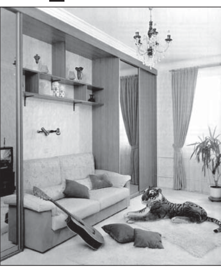
Проверка на прочность

После покупки мебели нужно проверить ее габариты не только по размерам комнаты, но и дверного проема - пройдет ли в него купленный диван?