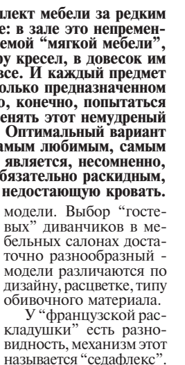
Диван в интерьере гостиной

Механизм "французской раскладушки" действует по принципу обычной, хорошо нам знакомой раскладушки. Укрепленное в ней реечное ложе изготовлено также из брезента. Но для частого, ежедневного раскладывания этот механизм не предназначен. Те, кто имеет подобные диваны, знают, что сетка довольно быстро приходит в негодность, пружины ослабевают, и она начинает скрипеть. В сложном виде диван компактен и много места не занимает. Механизм "французская раскладушка" устанавливается, как правило, на так называемые "гостевые"